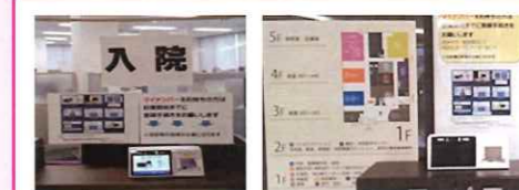
①総合受付 入院窓口 ②1Fエレベーターホール

ご不明な点がございましたら、職員にお声がけください。操作方法などをご説明いたします。