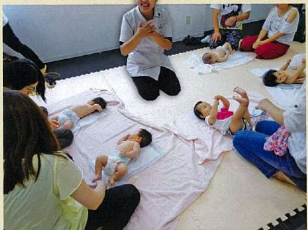
～ベビーマッサージ～