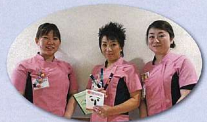
私達がフットケアを担当する看護師です。