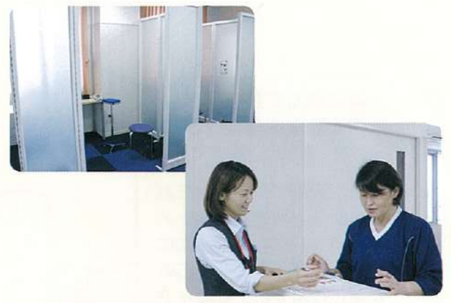
検査着をご用意しております。