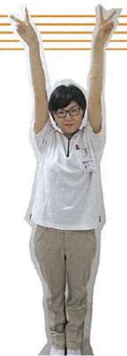
訪問看護 ステーションスタッフ