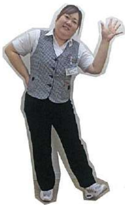
医療ソーシャルワーカー