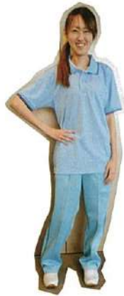
デイサービスセンター カルミア春江ケアワーカー