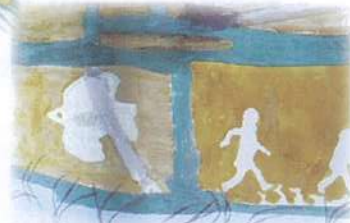
走るのが好きな春江病院職員をモチーフにしています