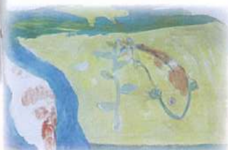
鯉が元気に泳いでいます