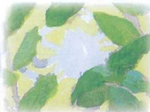
越前ガニをみつけられますか？