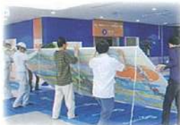
約80キロの巨大な越前和紙

福井県ならではの素材をと思い、1枚の大きな手漉き越前和紙「平成大紙」を選びました。