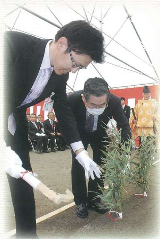
平成27年4月12日 新病院地鎮祭風景 針原地区に新病院建設 平成28年6月開院予定