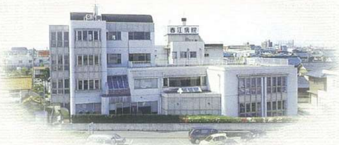
昭和45年7月 春江町江留下屋敷に移転 現在の春江病院