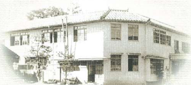
昭和29年1月 旧春江病院