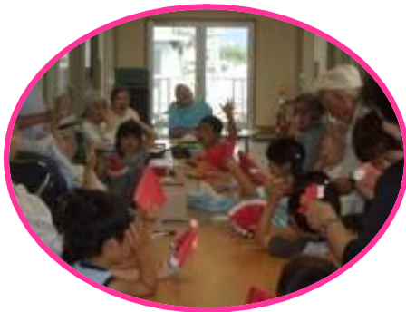
みどり保育園児と いっしょに交流会