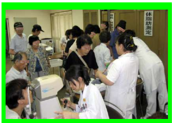
測定コーナーにて