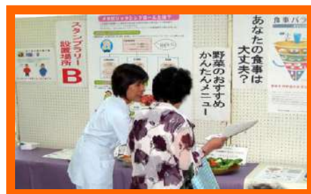
あなたの食事は、大丈夫・・・？